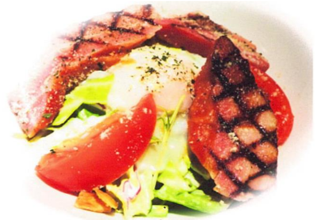
ベーコングリルと温泉玉子のシーザーサラダ