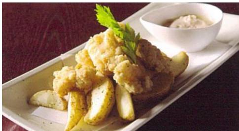
フィッシュ&チップス