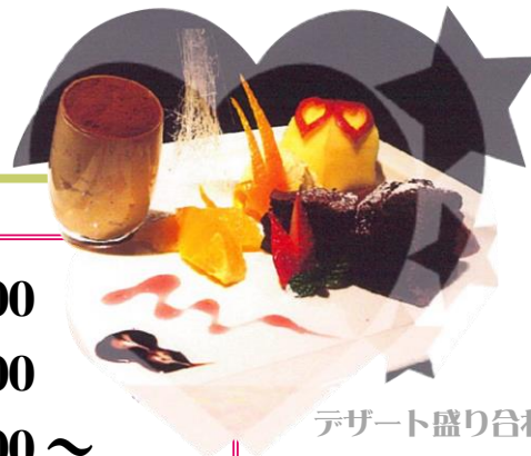
デザート盛り合わせ